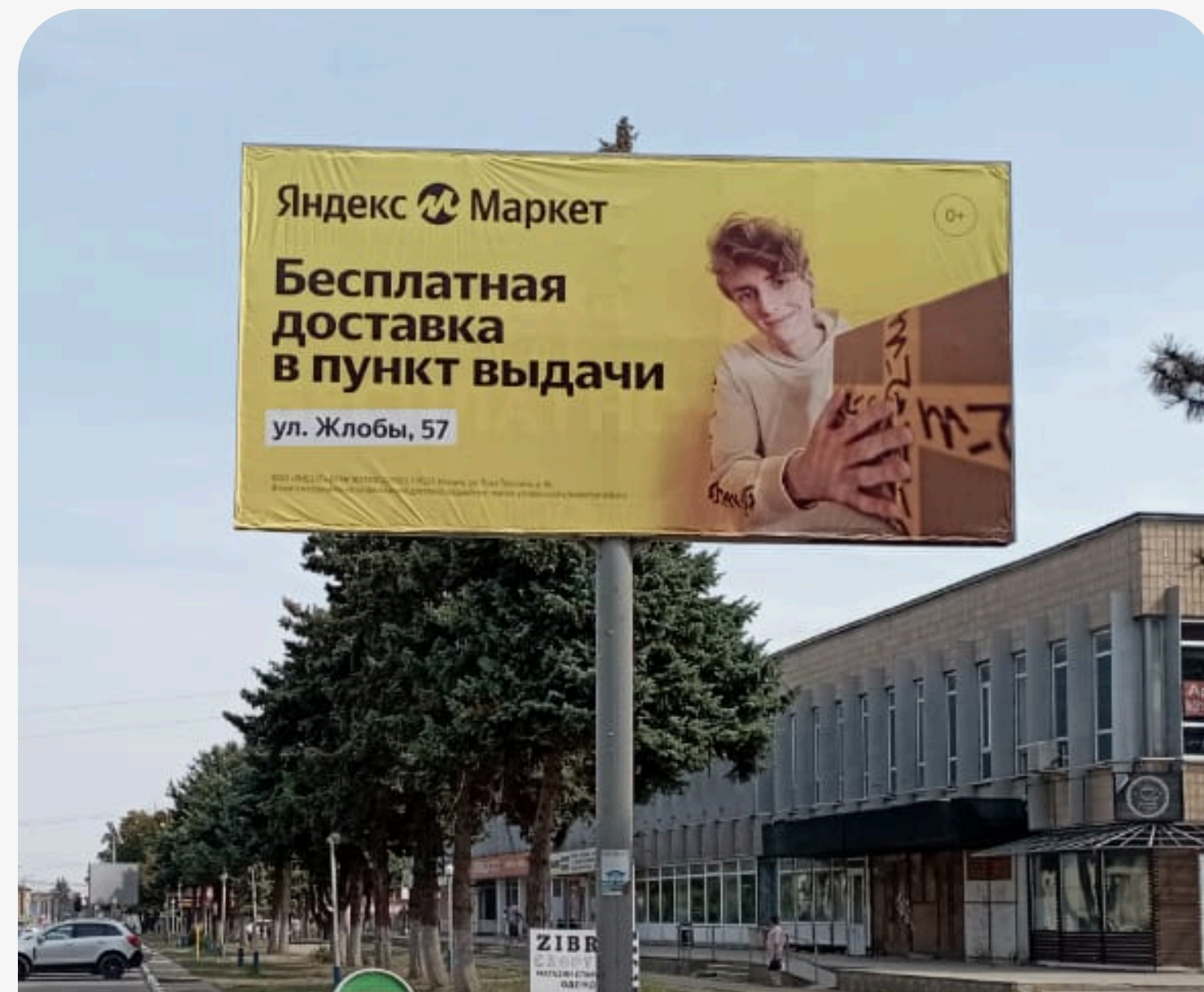
Размещение на билборде у пвз по адресу: ст. Ленинградская, ул. Кооперации, торговый центр