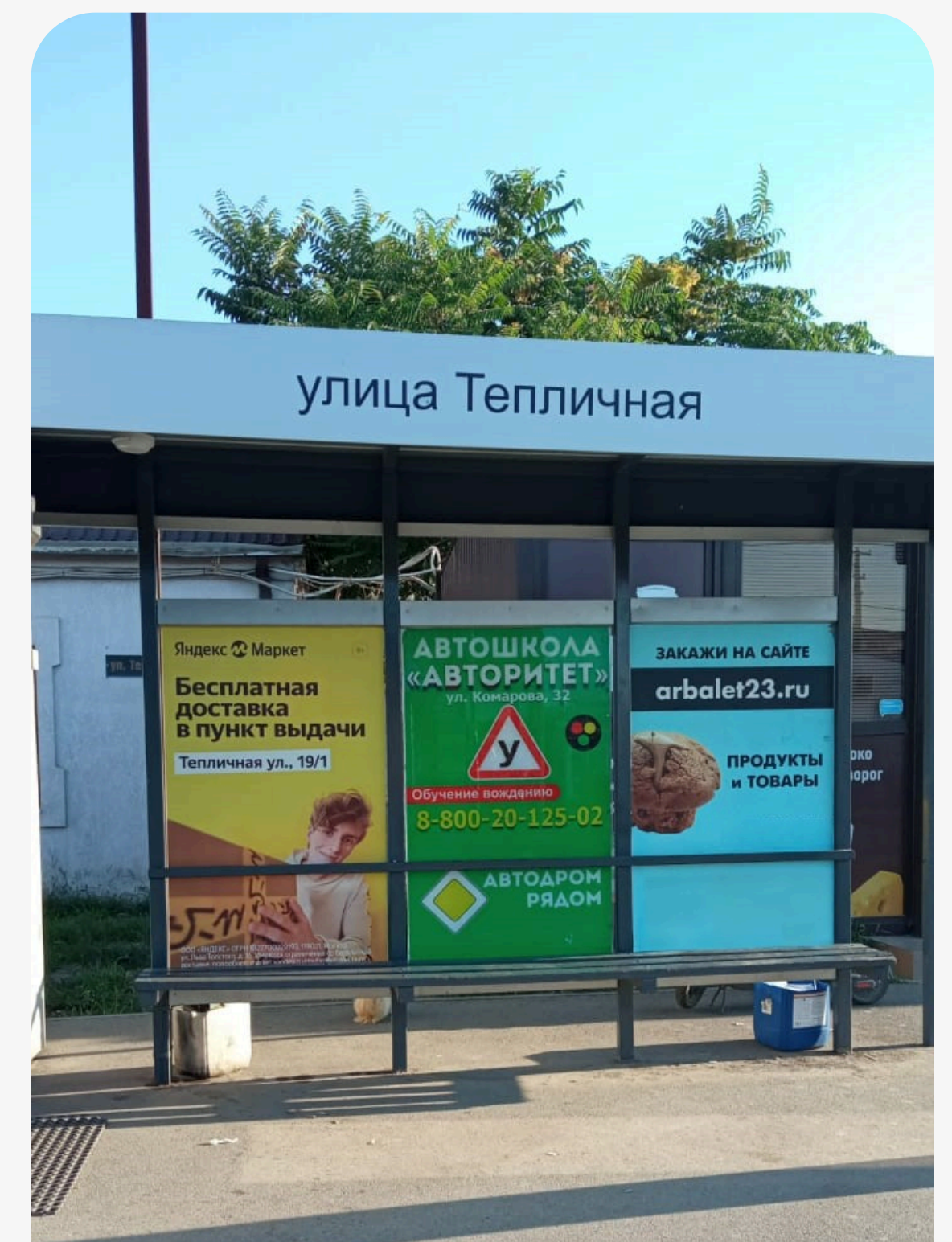
Остановочный павильон с рекламой Яндекс Маркет, расположенный в 300 м от пвз на: пос. Российский, ул. Тепличная, 17