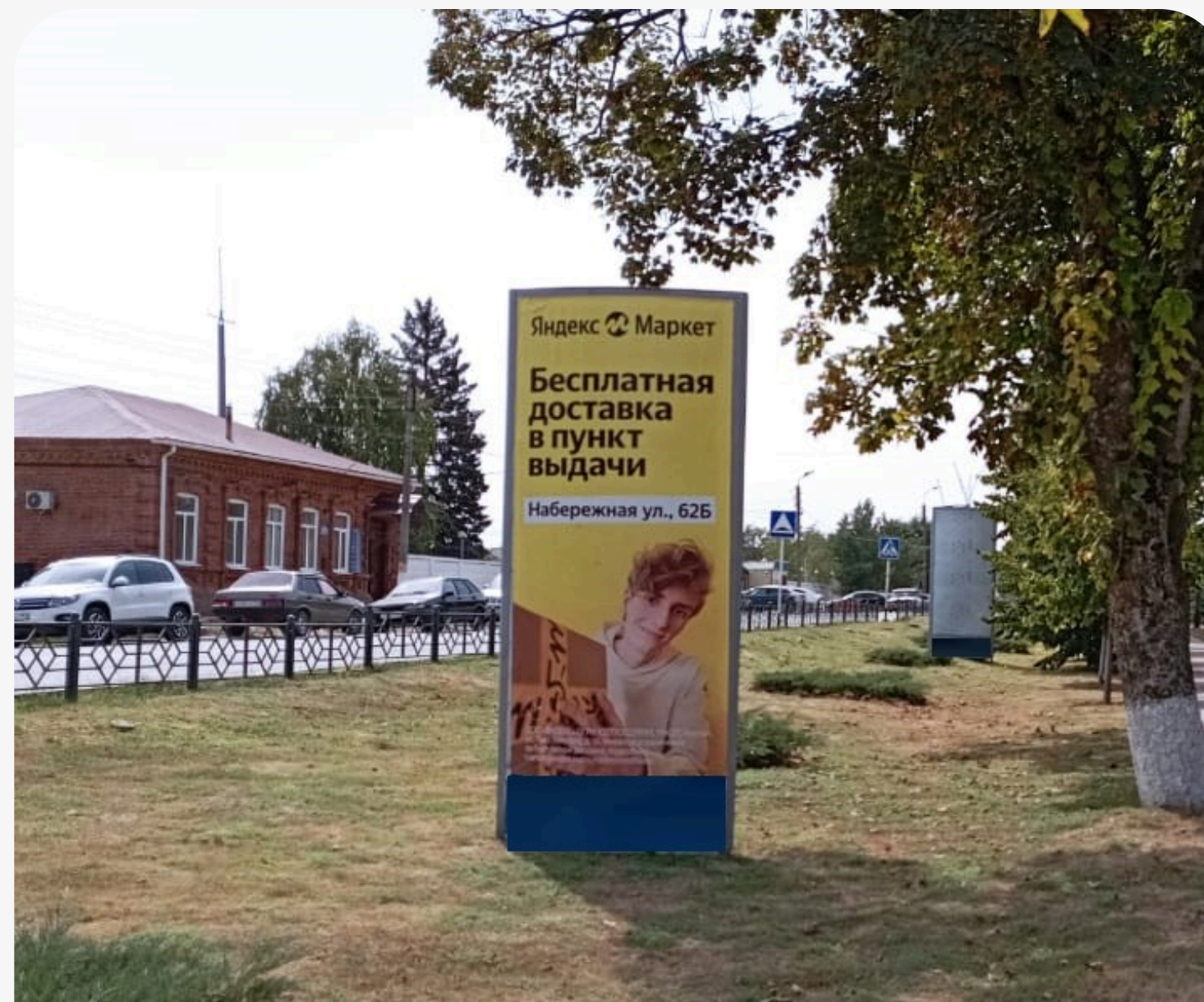
Пиллар в пешей доступности от пункта выдачи на: ст. Ленинградская, ул. Набережная, 29